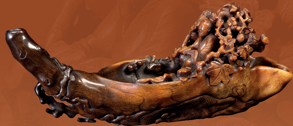
鲍天成制犀角雕仙人浮槎杯 明 (1368-1644)