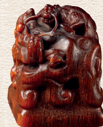
10 犀角雕蟠龙钮印 清（1644-1911）

明清时期江南地区的文房器具制作繁盛，犀角亦为其中一品。明末清初之际的文人士大夫尤其爱重犀角，这一阶段的犀角文房器具的艺术品格因而也特为突出。