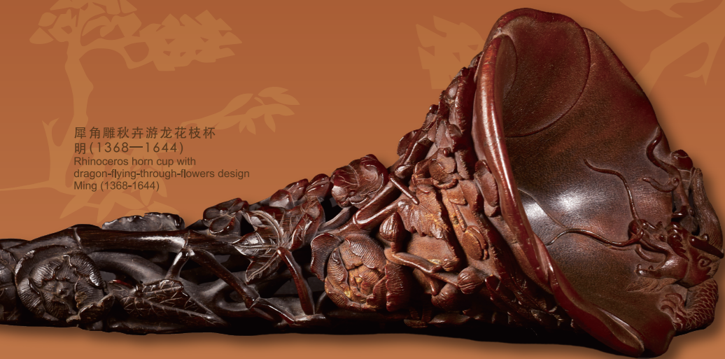
犀角雕秋千游龙花枝杯 明 (1368-1644) Rhinoceros horn cup with dragon-flying-through-flowers design Ming (1368-1644)