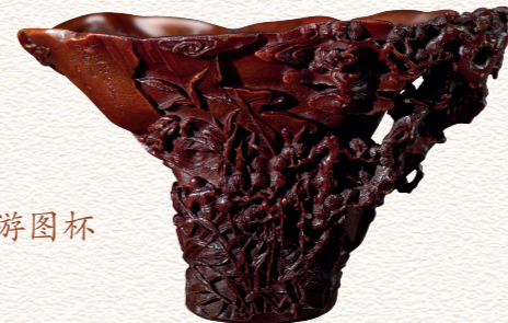
6 周文枢制犀角雕赤壁夜游图杯 明末清初（十七世纪） 仇大雄捐赠

山水人物犀角杯取法山水画的构图，多以雅集、高会、访友、泛舟、游山为题，或取赤壁夜游、兰亭修禊等故事。