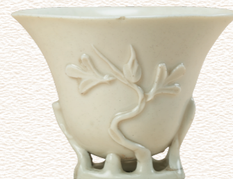
11 德化窑白釉堆花杯 明（1368-1644）

犀角杯因其材质稀有、造型自然灵动，成为工艺造物的典范之一，德化窑匠师通过模仿犀角杯的形态与雕刻样式，将这种审美理念融入白瓷制作中，形成了独特的瓷杯类型。