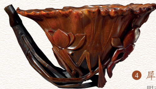
4 犀角雕“一把莲”荷叶吸杯 明末清初（十七世纪）

荷叶杯是叶形犀角杯中最受青睐的设计。而荷叶吸杯是荷叶杯中的特殊款式，渊源自北朝时期的“碧筒杯”。保留犀角尖端部分，经热弯曲加工后，设计为莲茎形吸管，杯内底有一洞与管相通，可通过吸管呷饮杯中美酒。