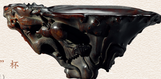
5 犀角雕“仙隐”杯 明末清初（十七世纪） 袁安圃捐赠

长松万仞，积石千寻，植物枝干的嶙峋健硕与岩石体块的磊落峻峭，是君子风骨峻峭的象征，因此以木、石为主题的犀角杯也成为颇受文人激赏的品种。