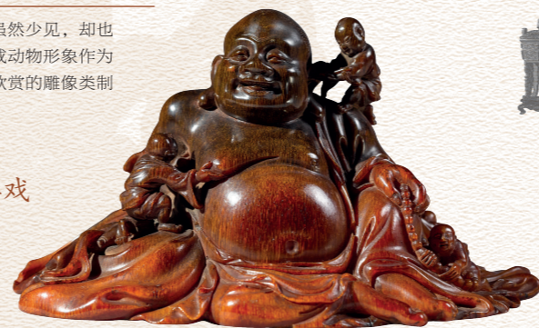
7 犀角雕弥勒婴戏 明（1368-1644）

单纯以人物或动物为主题的犀角器虽然少见，却也不乏成功的设计。其中既有以人物或动物形象作为装饰的实用器，也有可以独立陈设欣赏的雕像类制作。