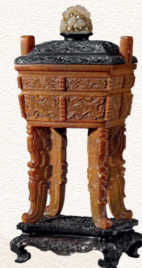
8 犀角雕兽面纹扁足方鼎 清（1644-1911）

犀角器多为随形制作，使得珍贵的原材料得到充分利用，但也有不少规矩器型。其中虽以杯类为多，也有碗、盘、瓶、炉、盒等什器，圆需中规，方则中矩，或者分割有意，对称有度。