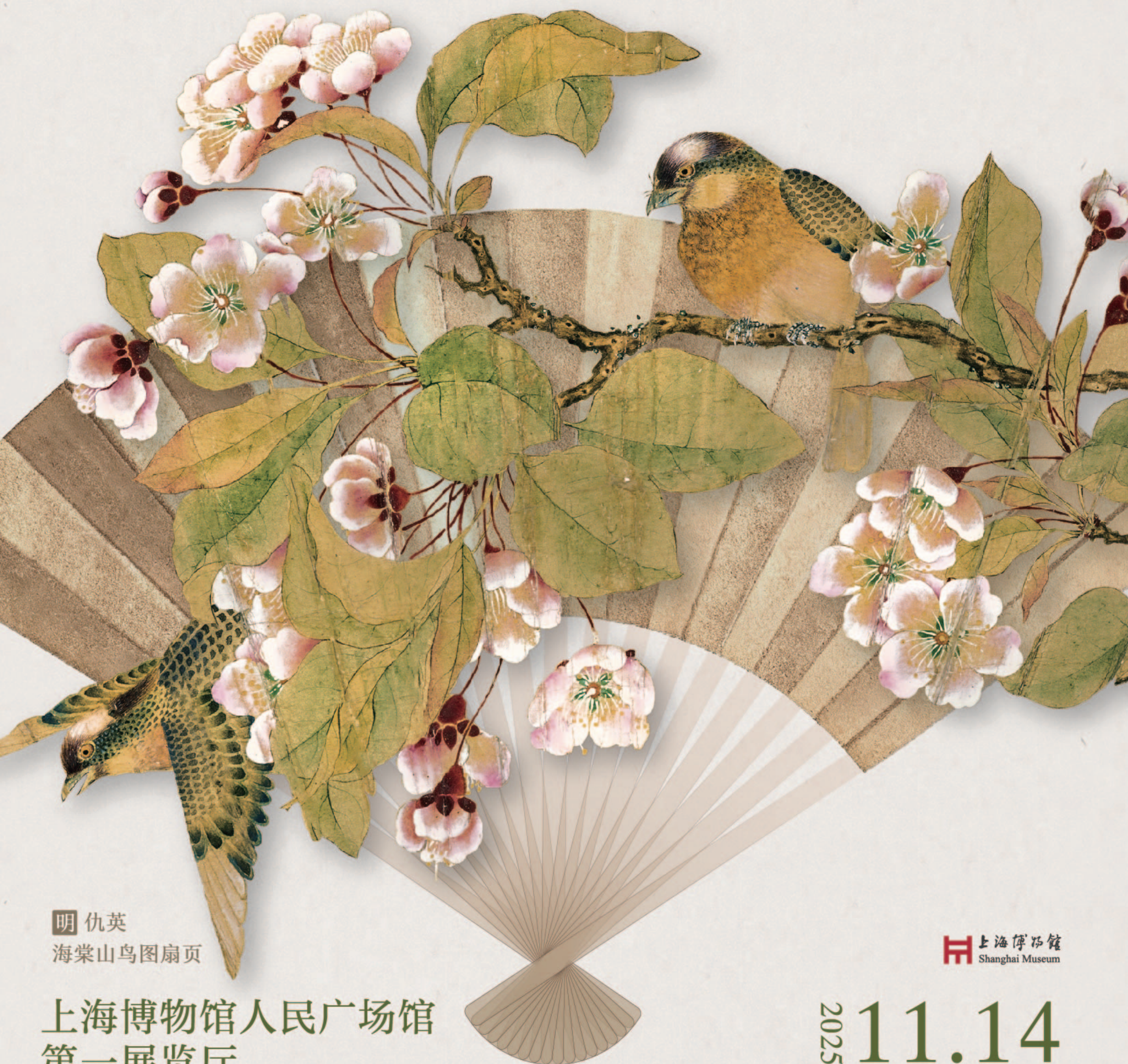
明 仇英 海棠山鸟图扇页

Masterpieces of Fan Painting and Calligraphy through the Ages from the Shanghai Museum Collection